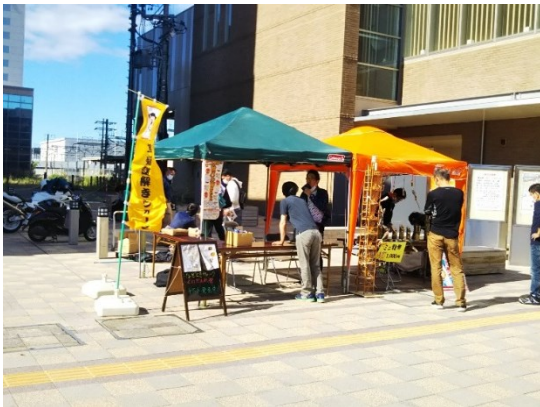
草薙謎解きウォーク商店街編 実施支援