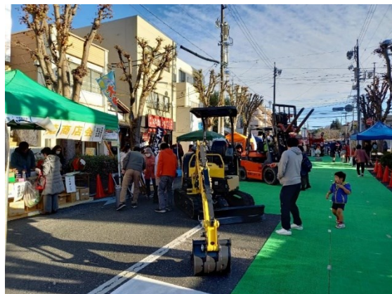
つながるくさなぎ冬フェス 2020 実施支援