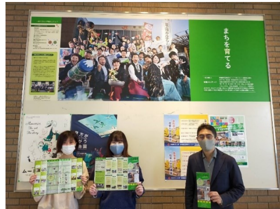
みちくさなぎの改訂