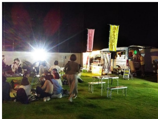
KUSANAGI まちなかオープンテラス Special Version