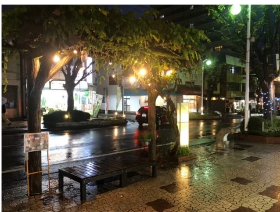
草薙商店街まちづくりプロジェクト 社会実験 2020